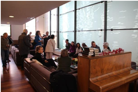
Lunch tijdens de cursistendag

Van cursisten valt regelmatig te horen dat ze verrast zijn en geboeid worden door wat ze in de lessen te horen krijgen. Het verruimt de kijk op dingen die (soms) allang bekend waren vanwege de eigen achtergrond. Maar het biedt ook heel veel nieuwe inzichten. Kortom: een ervaring! Als belangrijkste redenen om de cursus te doen, noemen cursisten verbreding en verdieping van het geloof, het meer en gedetailleerd omgaan met de rijkdom van de Bijbelse verhalen, de breedte en variatie van het cursusaanbod en ook om dit juist samen met anderen te doen die de behoefte aan verbreding en verdieping delen. Bij een uitgebreide cursusevaluatie in 2022 waren (nagenoeg) alle cursisten zeer positief; in een 'rapportcijfer' uitgedrukt, kwam het oordeel ruim boven de 9 uit. Een cursist verwoordde zijn ervaring op