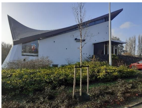
De Paaskerk in Amstelveen

Meer informatie over het TVG aanbod elders - we werken samen met andere TVG cursussen - kunt u vinden op de landelijke website van TVG's: www.tvg-algemeen.nl