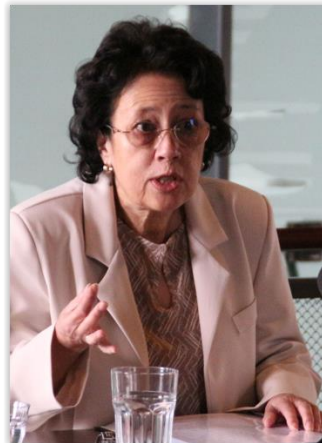
Gecertificeerde cursisten aan het woord op de afsluitende cursistendag